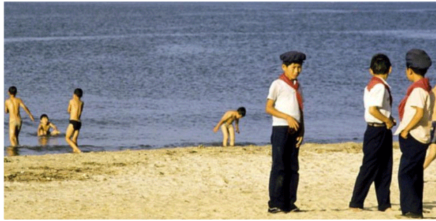
Pemerintah Korea Utara kini tengah mengembangkan wisata baharinya, dalam hal ini wisata selancar di pesisir timur negeri itu.